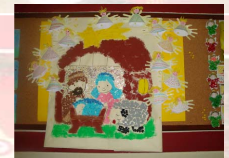
Trabalho Colectivo Infantil